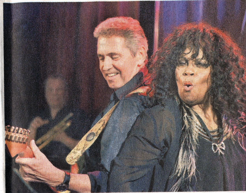
„Tina Turner“ auf der Wollfabrik-Bühne: Bei der „Sweet Soul Music Revue“ gab’s mächtig was auf die Ohren.